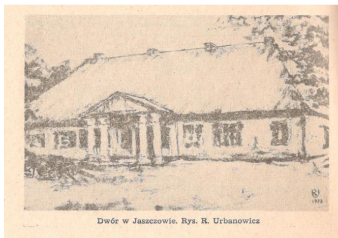
Dwór w Jaszczowie. Rys. R. Urbanowicz

W niedużej odległości od dworu do zbocza przylega kopiec, który według tradycji ma być grobem ariańskim. Za czasów Kickich był on nawet częściowo badany, znaleziono w nim wtedy szczątki trumny i kości.