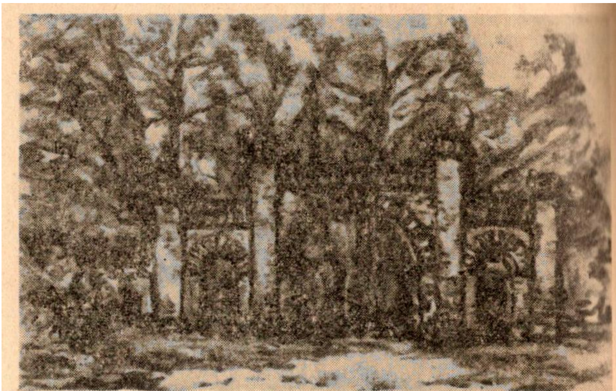
Brama wjazdowa w Mełgwi Podzamczu.