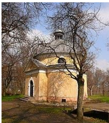
Kaplica parkowa