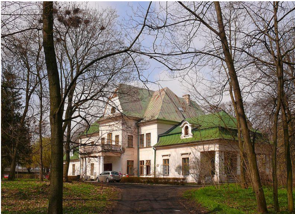
Pałac w Łysołajach – stan współczesny